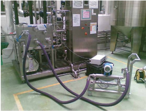
Mogućnost priključenja na razvodni panel